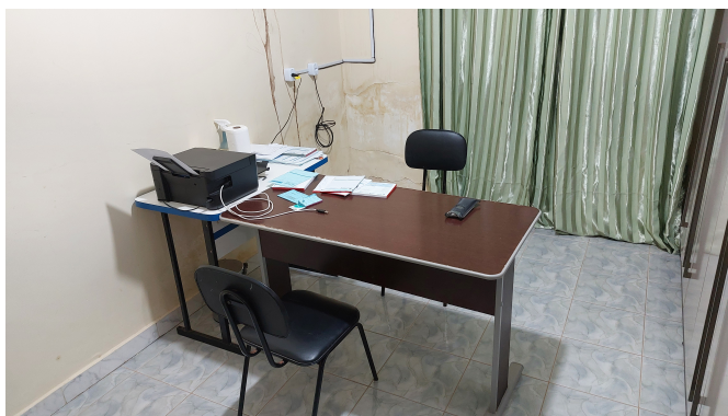
Figura 4: 677240404-UNIDADE DE SAUDE DA FAMILIA I CENTRO-4.