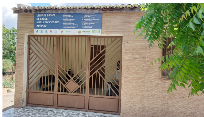
Figura 1: 677240401-UNIDADE DE SAUDE DA FAMILIA I CENTRO-1.