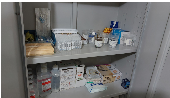
Figura 8: 677240408-UNIDADE DE SAUDE DA FAMILIA I CENTRO-8.