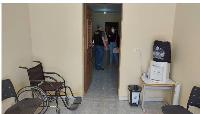
Figura 3: 677240403-UNIDADE DE SAUDE DA FAMILIA I CENTRO-3.