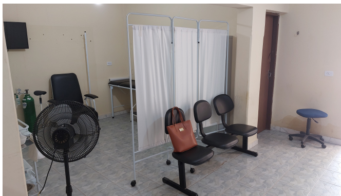
Figura 5: 677240405-UNIDADE DE SAUDE DA FAMILIA I CENTRO-5.