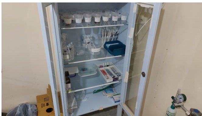
Figura 7: 677240407-UNIDADE DE SAUDE DA FAMILIA I CENTRO-7.