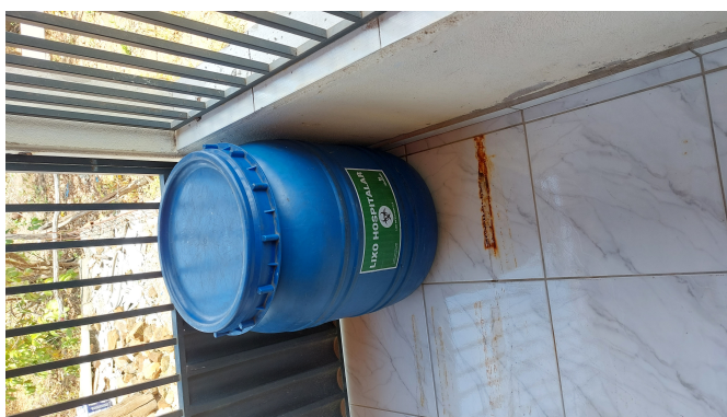
Figura 9: 677240409-UNIDADE DE SAUDE DA FAMILIA I CENTRO-9.