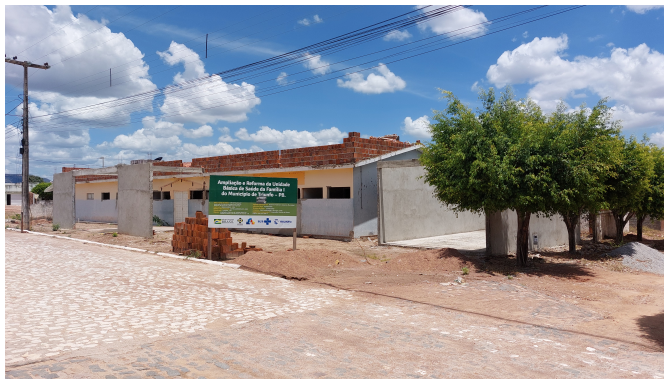
Figura 2: 677240402-UNIDADE DE SAUDE DA FAMILIA I CENTRO-2.